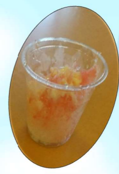
ブルーハワイ&いちご