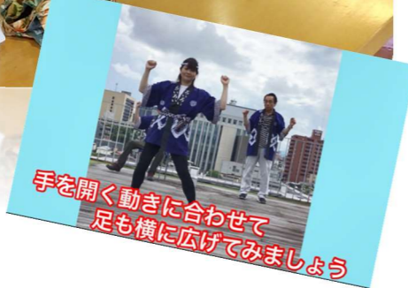
手を開く動きに合わせて 足も横に広げてみましょう